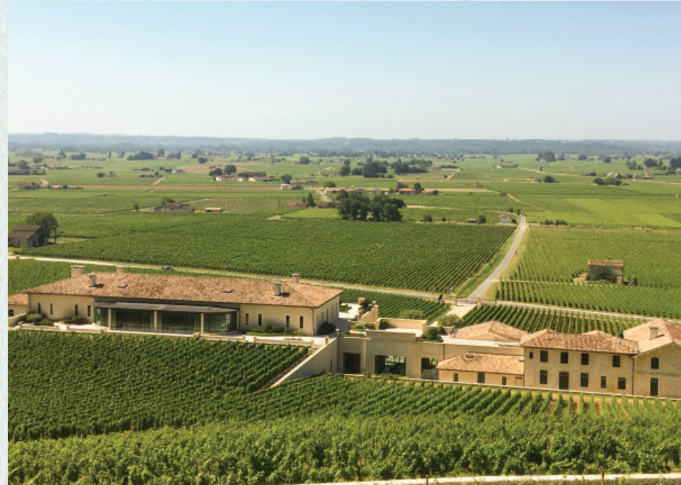
Château Pavie - St Emilion

Manejamos una lista de bodegas familiares para el consumo diario y una lista de Grands Crus en añadas excepcionales para ocasiones especiales.