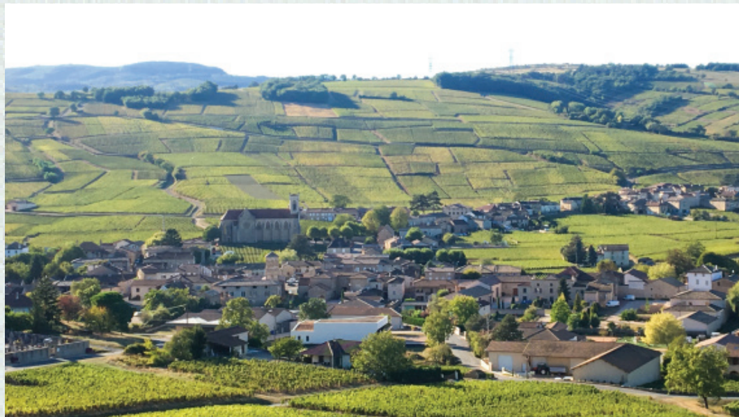
Domaine Denogent - Fuissé

Nos inspira el conocimiento, la pasión y la precisión que abarca el concepto de les climats , y lo que-remos aplicar al momento de seleccionar vinos para importar a México.