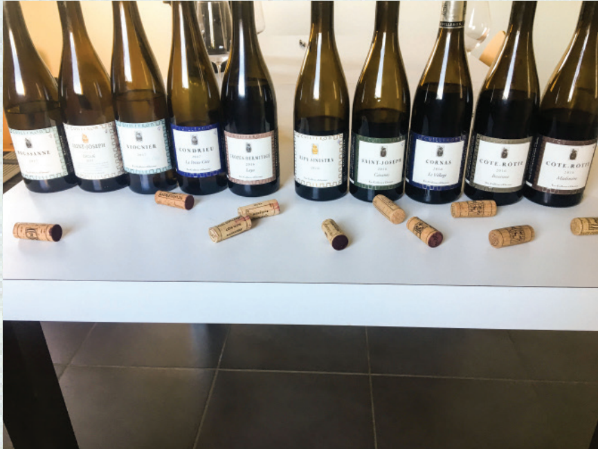
Domaine Yves Cuilleron - Vallée du Rhône