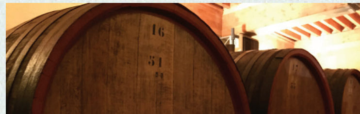
Domaine du Vieux Télégraphe - Chateuneuf du Pape

Tenemos mucha cercanía con los grandes Châteaux de Francia. Ello nos permite ofrecer un servicio exclusivo: conseguir casi cualquier vino y de cualquier añada, de primera mano desde el Château , en perfecto estado y a un costo preferente. Déjanos saber qué te gustaría conseguir.